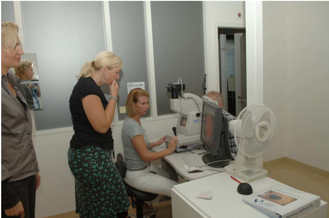
Workshop 2010 Screening