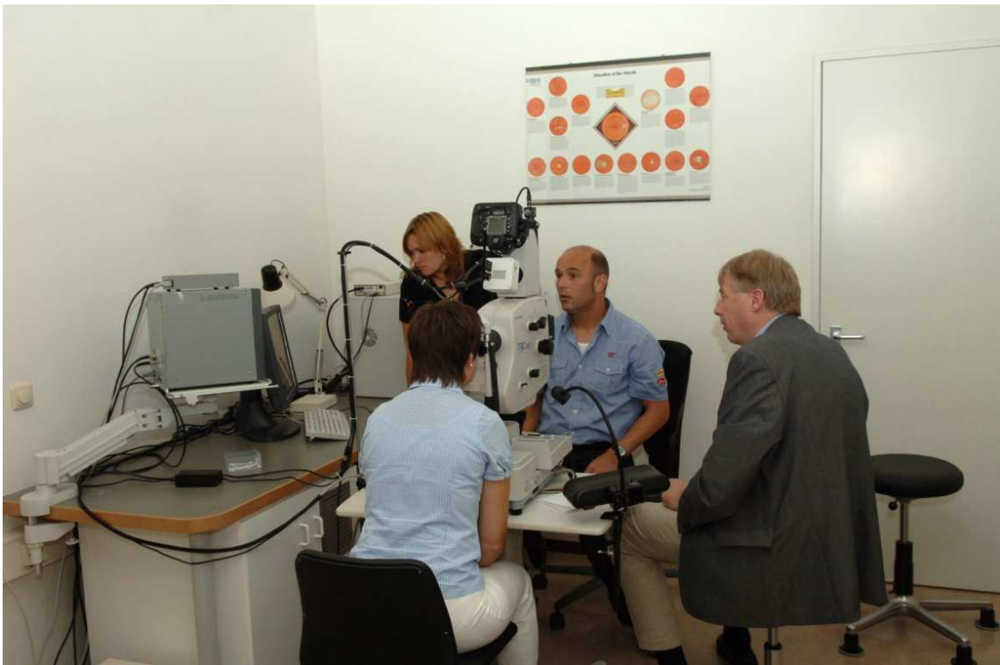
Workshop 2010 FAG en ICG